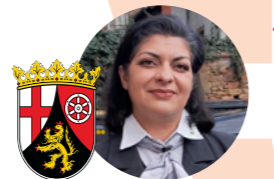
Jihan Hamo vlexx Rheinland-Pfalz

Im Hochsommer befindet sich eine größere Seniorengruppe auf dem Heimweg von Berlin nach Westfalen. Mehr als viereinhalb Stunden Verspätung türmen sich auf. Die Gruppe fragt sich, ob sie wohl heute noch zuhause ankommt. Inzwischen sind alle müde, und ihre Unruhe wächst. Im Zug von Hamm nach Münster beginnt dann das große Zittern, als der Zug außerplanmäßig zum Halten kommt. Die Gruppe wird wohl nachts in Münster stranden. Für Zugbegleiter Mesut Burus ist das aber keine Option. Er organisiert einen Gleiswechsel für einen kurzen Umsteigeweg. Mesut Burus bittet den Fahrdienstleiter, den Lokführer des Anschlusszugs zu kontaktieren, damit er auf die Seniorengruppe wartet. Für Lokführer Armin Dörr ist die Sache genauso klar wie für Zugbegleiter Mesut Burus: Niemand soll in Münster stranden. Der Plan der beiden geht auf. Alle kommen gut heim.